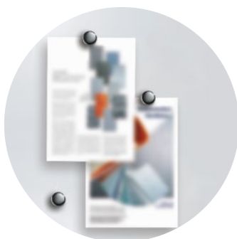
Aimantée et inscriptible au marqueur, gris, briller Code: HP 8208