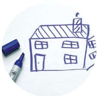
Aimantée et inscriptible au marqueur, blanc, briller Code: HP 8206