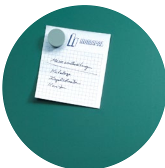
Aimantée et inscriptible à la craie, vert Code: HP 8211