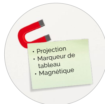
Surface de projection aimantée, inscriptible au marqueur, blanc, mat Code: HP 8207