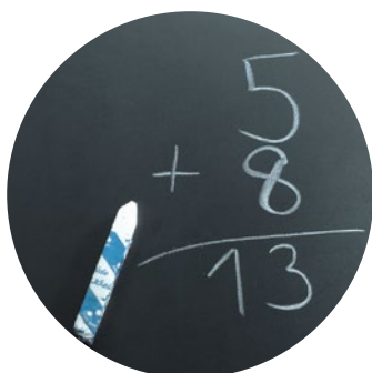
Aimantée et inscriptible à la craie, noir Code: HP 8205