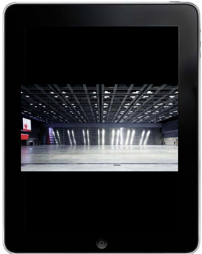
Le Qatar National Convention Center à Doha

National Arena - Glasgow, Écosse San Jose Convention Center, San José Suntec Convention Center, Singapour Chinese Recreation Center, San Francisco Le Grand Conference Center, Shelby Metro Toronto Convention Centre, Toronto Melton Civic Center, Leicestershire Burr Ridge Conference Center, Burr Ridge Austin Convention Center, Austin Qatar National Convention Center, Doha Hanwha Convention Center, Séoul DC Convention Center, Washington D.C. National Convention Center, Dublin Espace Culturel de Bondues, Bondues Daejeon Convention Centre, Daejeon Laguna Hills Civic Center, Laguna Hills Moody Gardens-Phase II, Galveston Convention Center, Galveston Moody Gardens-Phase I, Galveston Convention Center, Galveston Moscone Center West, San Francisco Ford Special Event Centre, Dearborn Charleston Civic Center, Charleston Lucas County Conference Centre, Toledo Cobo Hall Phase 3, Détroit Alliant Energy Center, Madison